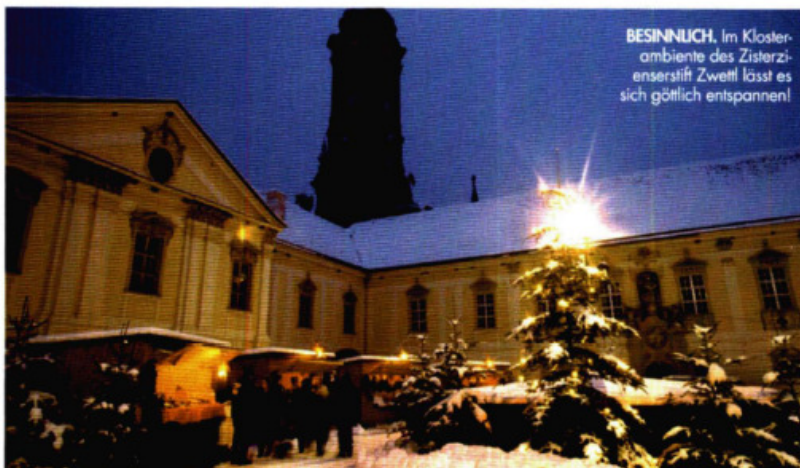
BESINNLICH. Im Klosterambiente des Zisterzienserstift Zwettl lässt es sich göttlich entspannen!